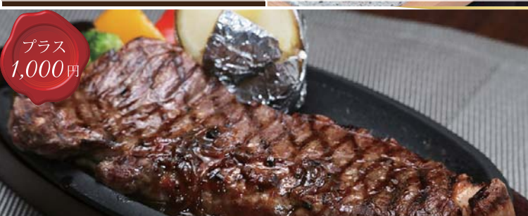
那須和牛サーロインステーキ(150g)