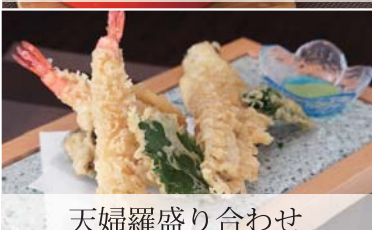
天婦羅盛り合わせ