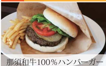
那須和牛100%ハンバーガー