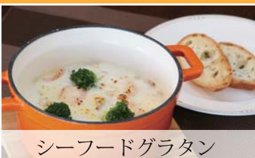
シーフードグラタン