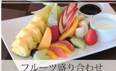
フルーツ盛り合わせ